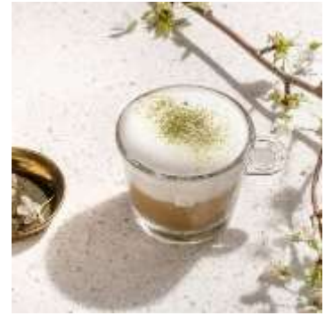
抹茶を使ったアイスコーヒー