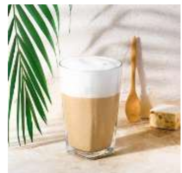
アイス・マッキャート

暑い夏に爽やかさを運ぶ、ネスプレッソのアイスコーヒーで至福の一杯をご体験ください。