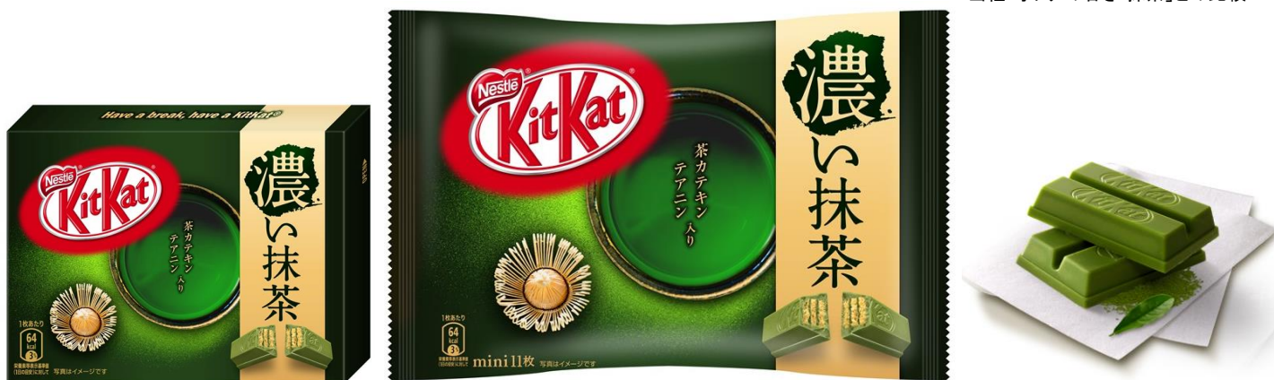
【左から】キットカット ミニ 濃い抹茶 3枚、11枚、チョコレートバー