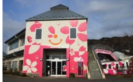
吉浜駅舎&キット、ずっと2号