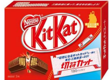
「キットカット ミニ 切符カット」 (販売終了)