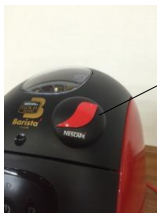
専用端末「ビーコン」