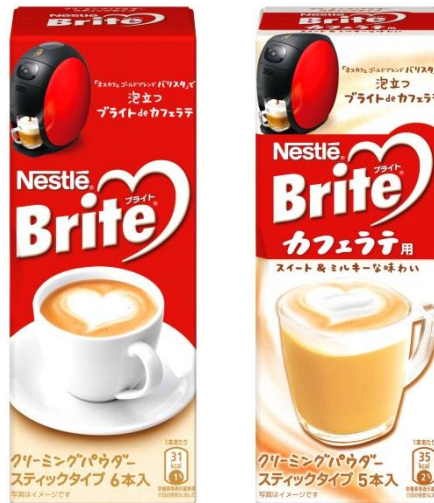
写真(左から):「ネスレ ブライト スティック 6本入り」「ネスレ ブライト カフェラテ用 5本入り」