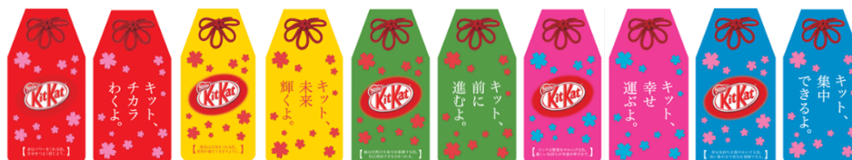
(同梱)「キット、願いかなう」しおり 左:表 右:裏