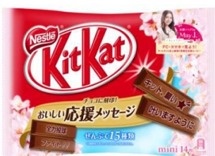
ネスレ キットカット ミニ 受験メッセージパック(14枚入り)

「キット、願い★叶いますように」など15種類もの応援メッセージが「キットカット」に刻印された「ネスレ キットカット ミニ 受験メッセージパック」。そして、スタンダードなミルクチョコレートとホワイトチョコレートのふたつの味が楽しめ、ホワイトチョコレートの個包装には、連携する20大学ならではの応援メッセージを掲載している「ネスレ キットカット ミニ 紅白パック」。2種類を2015年の受験生応援商品として12月15日(月)より発売。