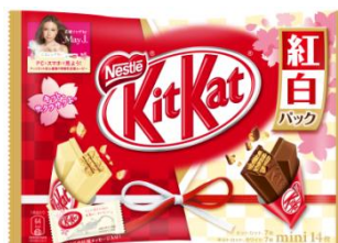
ネスレ キットカット ミニ 紅白パック(14枚入り)