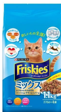
「新フリスキードライ 1.1kg」

新しい「フリスキードライ」で伝えたいことは、英語の「フリスキー＝活発、元気な」という言葉に込められた、イキイキと元気な毎日を過ごせるようにという願いです。「フリスキードライ」によって、「おいしさ」「栄養」「飼い主の愛情」という、ネコちゃんの「欲しいもの全部!」が手に入るという、ブランドのメッセージを新しいパッケージに込めました。