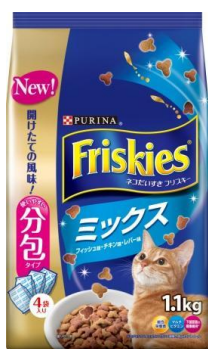
「旧フリスキードライ 1.1kg」

新しい「フリスキードライ」は、従来の濃紺を背景としたデザインから、明るい青色を主体としたさわやかなデザインに生まれ変わります。