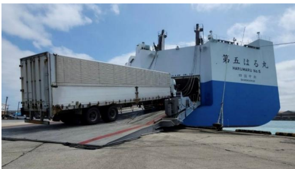
千葉港(千葉県千葉市)で、トラックが船に乗り入れる様子

(※1) 荷物を届けた後の復路で別の荷物を運ぶことで空荷を減らし、効率を高める方法のこと