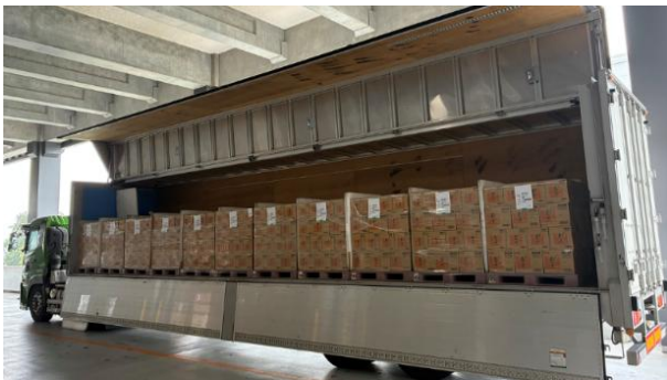
キッコーマン食品 N-DC(千葉県流山市)を出発するトラック

左から: ネスレ日本「ネスカフェ ゴールドブレンド」、 キッコーマン食品「キッコーマン 濃いだし 本つゆ」