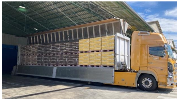
ネスレ日本 姫路工場(兵庫県姫路市)を出発するトラック

ネスレ日本は、1967年に日本で初めてフリーズドライ製法を採用したコーヒーとして「ネスカフェ ゴールドブレンド」を発売しました。1971年からはネスレ日本 姫路工場(兵庫県姫路市)で国内生産を開始し、日本で最も飲まれているソリュブルコーヒー(※2)として、長年にわたり親しまれています。