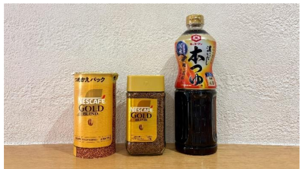
輸送する製品の例

左から: ネスレ日本「ネスカフェ ゴールドブレンド」、 キッコーマン食品「キッコーマン 濃いだし 本つゆ」