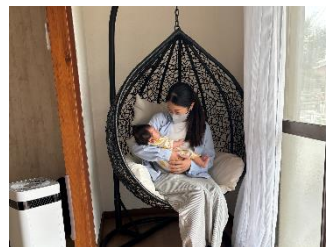
利用者の様子・ハンギングチェア