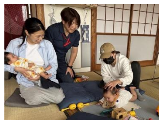
利用者の様子・カフェラウンジ