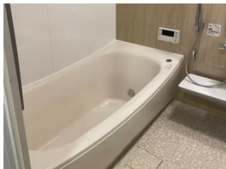
ママが1人で入れるお風呂