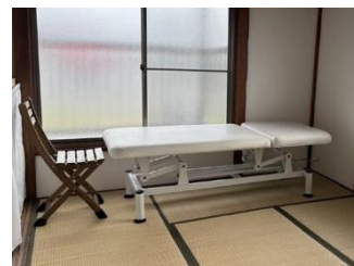
マッサージやよもぎ蒸しに使用する部屋