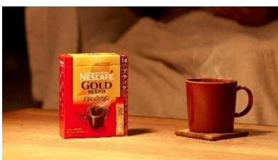
画像(イメージ): 「ネスカフェ ゴールドブレンド カフェインレス」

製品情報: https://nestle.jp/home/brands/nestle/lineup/goldblend-caffeineless