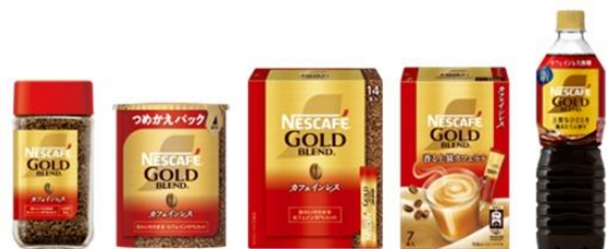
画像: 「ネスカフェ ゴールドブレンド カフェインレス」シリーズ