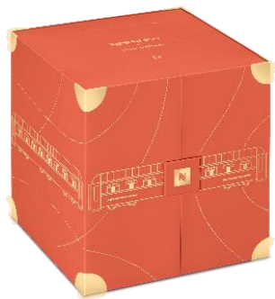
「アドベントカレンダー ヴァーチュオ 2024」 価格: 税込価格 8,910 円 (本体価格 8,100 円)

冬の数量限定コーヒーを含む 23 種類のカプセルコーヒーと、24 日目には特別なギフトが隠れています。すべての車両のドアを開き、遊び心たっぷりのサプライズをお楽しみください。