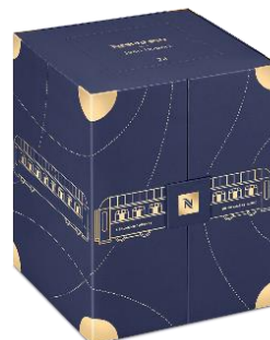
「アドベントカレンダー オリジナル 2024」 価格: 税込価格 8,360 円 (本体価格 7,600 円)