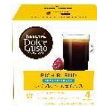
リッチブレンド カフェインレス 16杯分