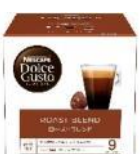
ローストブレンド 16杯分