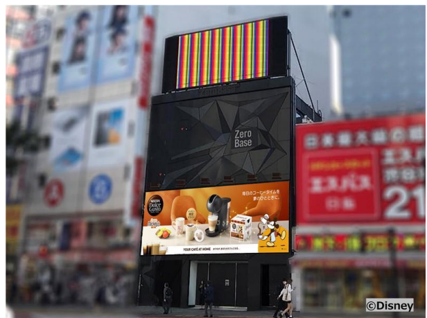
イベントを開催する ZeroBase 渋谷