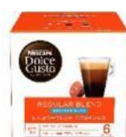
レギュラーブレンド カフェインレス 16杯分