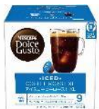
アイスコーヒーロースト XL 16杯分