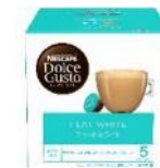
フラットホワイト 16杯分