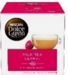
ミルクティー 16杯分