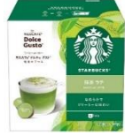
抹茶 ラテ 6杯分