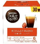
レギュラーブレンド 30杯分