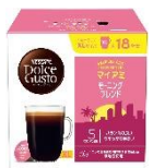
マイアミ モーニングブレンド 18杯分