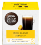
リッチブレンド 16杯分