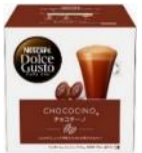
チョコチーノ 8杯分