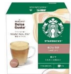
カフェ ラテ 12杯分