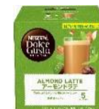
アーモンドラテ 12杯分