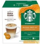
キャラメル マキアート 6杯分