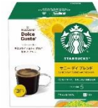
サニー デイ ブレンド 12杯分