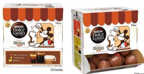
「ネスカフェ ドルチェ グスト <バリスタミッキー> バラエティカプセルセット 48P <40 杯分>」