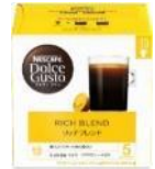
リッチブレンド 30杯分