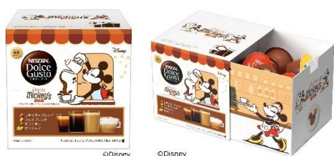
「ネスカフェ ドルチェ グスト <バリスタミッキー> バラエティカプセルセット 16P <14 杯分>」