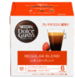
レギュラーブレンド 16杯分