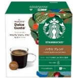
ハウス ブレンド 12杯分