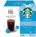
アイス アメリカーノ 12杯分