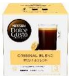
オリジナルブレンド 16杯分