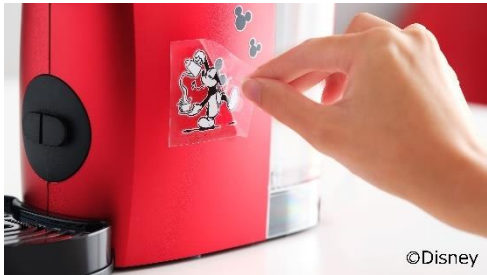
<パスタミッキー>ステッカーを貼ってオリジナルデザインの一合に

「ネスカフェ ドルチェ グスト GENIO S TOUCH (ジェニオ エス タッチ) <パスタミッキー> カフェ体験セット」の楽しみ方 <パスタミッキー>ステッカーをコーヒーマーカー「ネスカフェ ドルチェ グスト GENIO S TOUCH (ジェニオ エス タッチ)」のサイドパネルの好みの場所に貼ると、自分だけの「パスタミッキー」デザインの一合ができてあがります。デコレーションしたコーヒーマーカーでお気に入りのカフェメニューを抽出し、おうちでカフェ気分が味わえます。 さらに、「ネスカフェ ドルチェ グスト GENIO S TOUCH (ジェニオ エス タッチ)」と「ネスカフェ ドルチェ グスト 専用カプセル カプチーノ」を使って<パスタミッキー>マグカップにカプチーノを抽出し、<パスタミッキー>ステンシルを置いてココアパウダーなどの好みのパウダーをかければ、ミッキーのラテアートが乗ったドリンクが完成します。