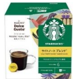
ライトノート ブレンド® 12杯分