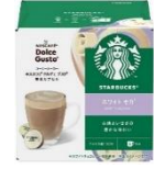
ホワイト モカ 6杯分