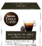
エスプレッソ インテンソ 16杯分