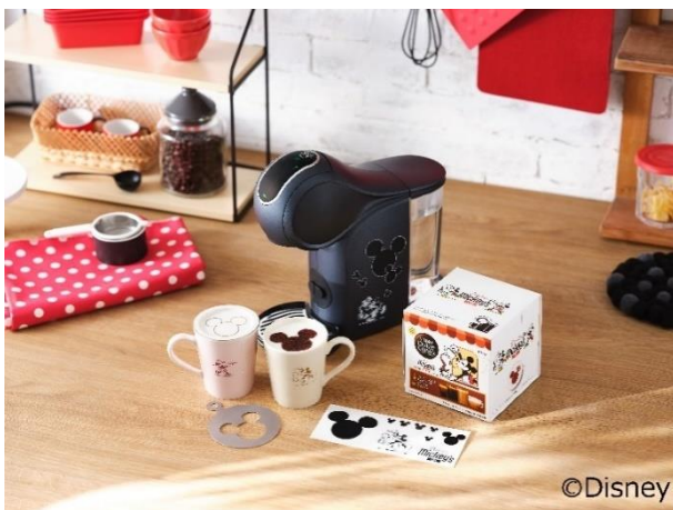
「ネスカフェ ドルチェ グスト GENIO S TOUCH (ジェニオ エス タッチ) ＜バリスタミッキー＞ カフェ体験セット カプセルアソート」

また、「バリスタミッキー」限定デザインの製品に囲まれながら、“夢のひとつとき”を体験できる期間限定イベントを、10月16日(水)から10月27日(日)までの間、東京・渋谷で開催します。