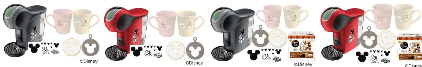
画像(左から):「ネスカフェ ドルチェ グスト ジェニオ エス タッチ <バリスタミッキー> カフェ体験セット」(スペースグレー、レッドメタル)、 「ネスカフェ ドルチェ グスト ジェニオ エス タッチ スペースグレー <バリスタミッキー> カフェ体験セット カプセルアソート」(スペースグレー、レッドメタル)

バラエティカプセルセット 48P https://www.amazon.co.jp/dp/B0DGGSPVWTD