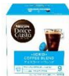
アイスコーヒー ブレンド 16杯分