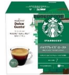
パイクプレイス® ロースト 12杯分