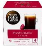
モカブレンド 16杯分