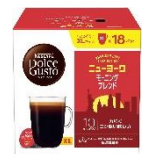
ニューヨーク モーニングブレンド 18杯分