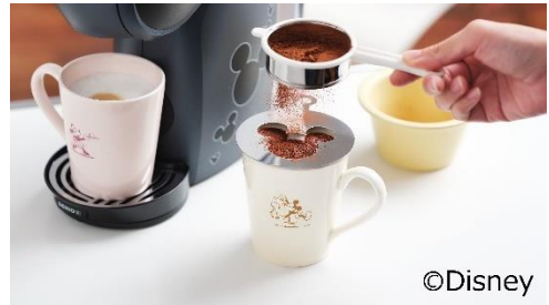
<パスタミッキー>ステンシルを使ってミッキーのラテアートが施せます