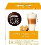
ラテ マキアート 8杯分