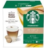
ラテ マキアート 6杯分