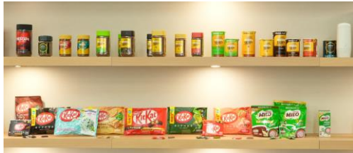
本社13階 製品展示エリア

授業の取り組み方法を共有させていただくことで、サステナブルな社会づくりの一助となることを願っています。皆様からのご応募をお待ちしております。