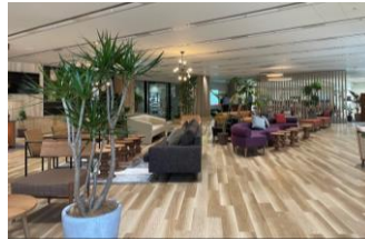
本社14階 オフィスエリア