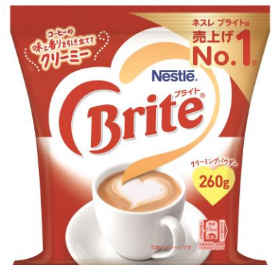
画像：「ネスレ ブライト 260g」