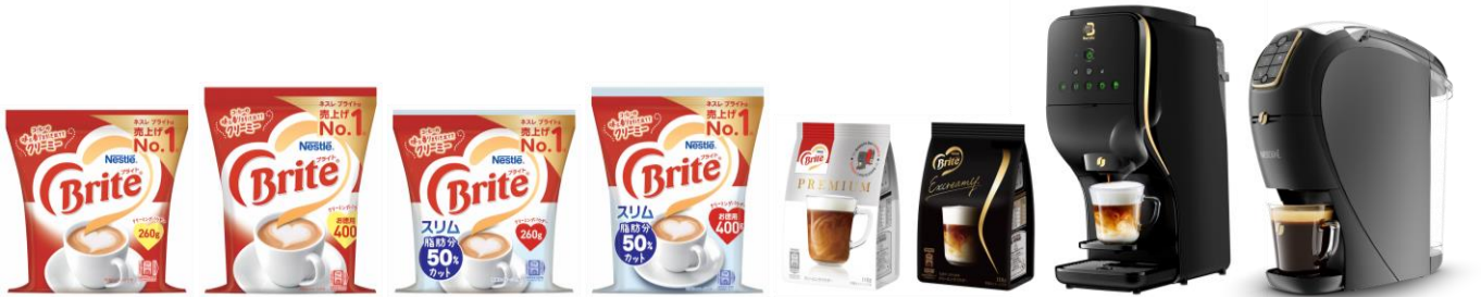
画像(左より): 「ネスレ ブライト 260g」、「同 400g」、「ネスレ ブライト スリム 260g」、「同 400g」、「ネスレ ブライト プレミアム 110g」、「ネスレ ブライト エクスクリーミー 110g」、「ネスカフェ ゴールドブレンド バリスタ デュオ」、「同 slim[スリム]」