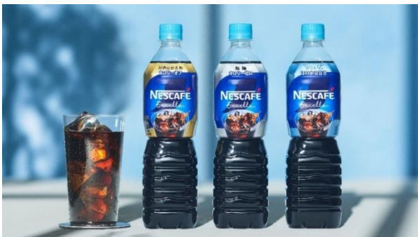
「ネスカフェ エクセラ ボトルコーヒー」

2024年2月15日(木)発行のプレスリリース: https://www.nestle.co.jp/media/pressreleases/20240215_nescafe_1