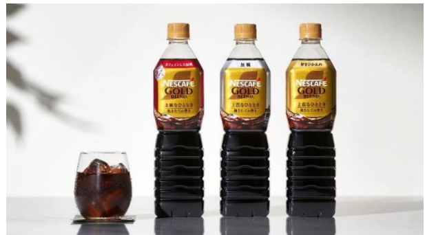
「ネスカフェ ゴールドブレンド 上質なひととき ボトルコーヒー」