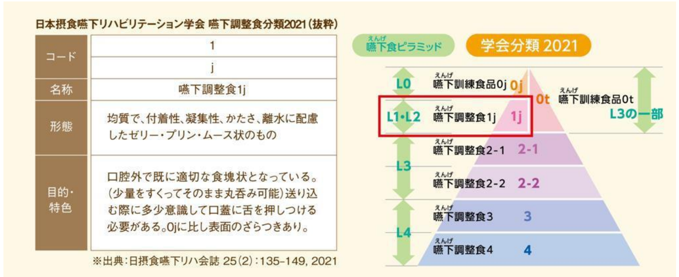
日本摂食嚥下リハビリテーション学会 嚥下調整食分類 2021(抜粋)

日本摂食嚥下リハビリテーション学会 嚥下調整食分類 2021(学会分類 2021)のコード 1j 相当に調整し、物性のバランスを追求しました。