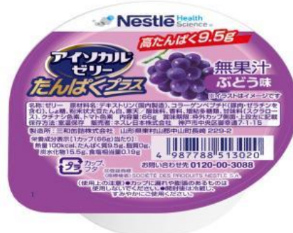
左から:パイナップル味、ぶどう味