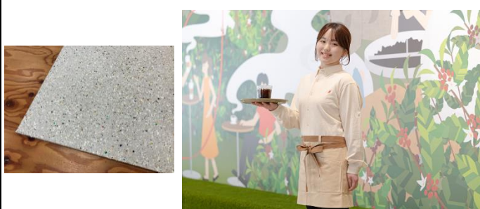
「ネスカフェ ゴールドブレンド エコ&システムパック」の紙パッケージを使用し、アップサイクルしたテーブルの天板(左)とユニフォーム(右)