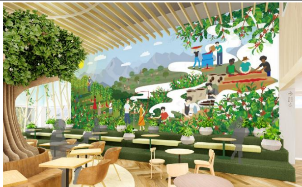
「Farm to cup(農園からカップまで)」のストーリーを描いたグラフィックを背面に施し、コーヒー生産地を想起させる階段席