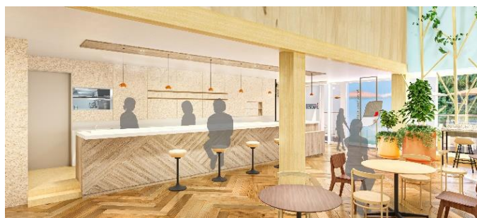
マグカップ型のペンダントライトが可愛らしくも、クラフト感溢れるカウンター席