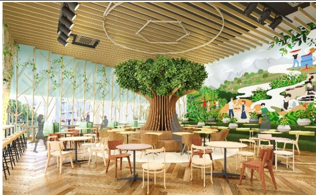
コーヒー農園のような解放感と温かみのある空間 中央はリサイクル可能な段ボールで制作したシンボルツリーを配置