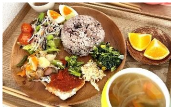
昼食(バランス健康食のワンプレートごはん)