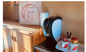
ドリンクコーナー