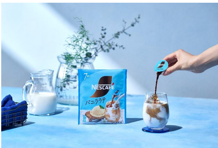
新製品の「ネスカフェ ポーション バニララテ」

ネスレは、グローバルコーヒーブランド「ネスカフェ」において、2023年より新コンセプト“Make your world”(※参考資料)を掲げ、これからも皆様がおいしいコーヒーを飲み続けられる未来のために、サステナビリティに取り組むことを表明しています。「ネスカフェ」を通じて、自分好みのコーヒーやアレンジを見つけながら「自分らしい世界」を楽しむことをサポートするため、様々な製品を提案しています。