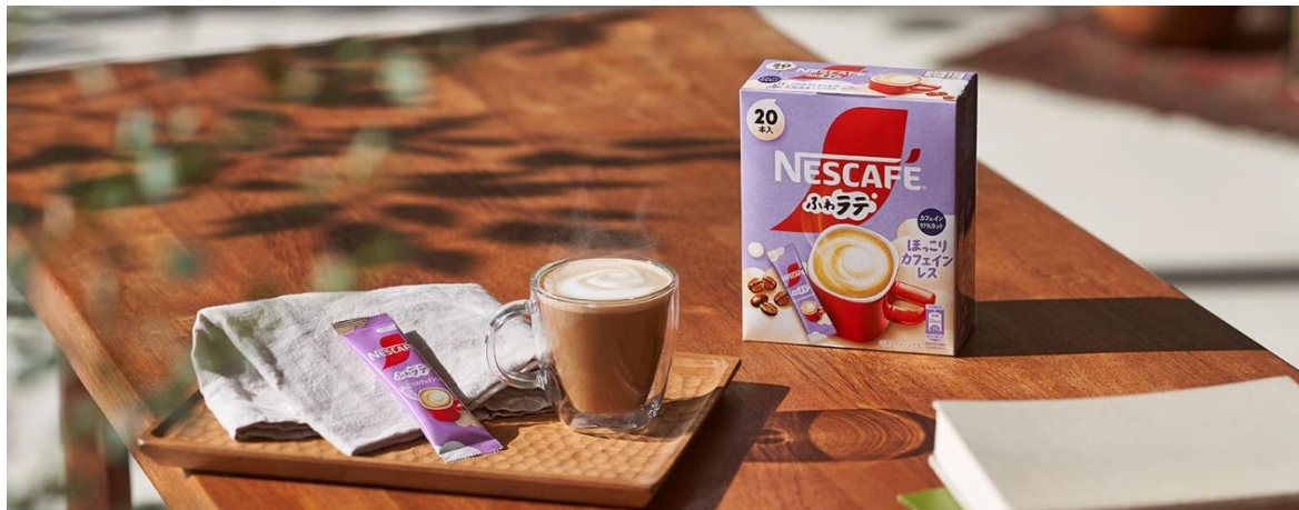
画像:「ネスカフェ ふわラテ ほっこりカフェインレス」