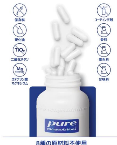
8種の原材料不使用

※2 医療専門家に最も推奨されるサプリメントブランド (アメリカ合衆国内におけるブランド調査) Nutritional Business Journal® 2016, 2020