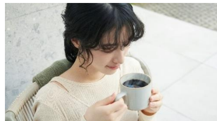
香り豊かなコーヒーを楽しみ リラックスタイムを過ごします。