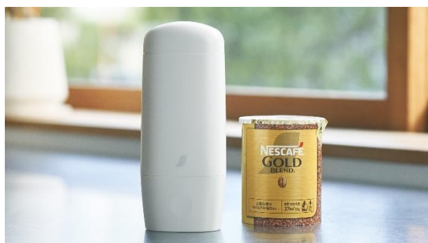
「ネスカフェ Keepo スターターパック」

ブランドサイト: https://shop.nestle.jp/front/contents/machine/keepo