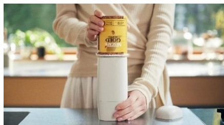
「ネスカフェ Keepo」に「ネスカフェ ゴールドブレンド エコ&システムパック」でソリュブルコーヒーを充填します。

このたび新発売する「ネスカフェ Keepo」は、シンプルな容器にさりげなく「ネスカフェ」のアクセント(※フランス語で「アクセント」の意味)マークがポイントとしてあしらわれた、インテリアになじむスタイリッシュなデザインが特長の密閉キャニスターです。袋タイプのソリュブルコーヒー ユーザーの多くが、購入後に別の容器に「詰め替え」を行っている一方で、“製品をそのままを部屋に置くと生活感が出てしまう”、“他の瓶に詰め替えて湿気ってしまわないか心配”、“一杯分を計るのが面倒”といった声が多く聞かれました。高い気密性で湿気からコーヒーの香りを守る「ネスカフェ Keepo」を使用すれば、「ネスカフェ ゴールドブレンド」の味や香りをキープして詰め替えられるだけでなく、下部のダイヤルを回転させるだけで、適量(※1)を出すことができます。(※1)ダイヤル1回転でコーヒー約1g、2回転の約2gに対し140mlのお湯が1杯分になります。