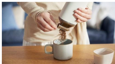
下部のダイヤルを2回転させて コーヒー1杯分を出し、お湯を注ぎます。