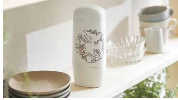
画像(左から):「ネスカフェ Keepo 辻元 舞モデル“birds”」、「ネスカフェ Keepo 辻元 舞モデル“circle”」