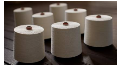
プロジェクト「TSUMUGI」の紙糸

2023年2月の一般社団法人アップサイクルの設立以来、プロジェクト「TSUMUGI」の紙糸を使用して作られた物品は、主に参画企業・団体内のユニフォームやノベルティとして活用されてきました。「商品として購入したい」という多くのお声に応えるために、このたび商品の一般販売を開始する運びとなりました。なお、商品のデザインは、一般社団法人アップサイクルの参画企業のうちの1社であるネスレ日本の社員が担当し、ネスレ日本の本社がある「神戸」や「六甲山」をコンセプトにしています。