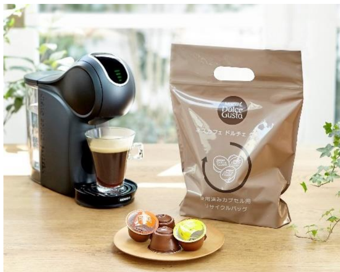
専用回収袋と「ネスカフェ ドルチェ グスト」のカプセル、コーヒーマーカー

世界 188 ヶ国で事業を展開する世界最大の食品飲料企業・ネスレは、2025 年までにバージンプラスチックの使用を 3 分の 1 削減すること、プラスチックパッケージの 95%以上をリサイクル可能に設計することを目指しています。このコミットメントの達成に向けた一環として、ネスレ日本では製品パッケージの改善や、廃棄物の削減を目指して、サーキュラーエコノミーの構築に向けた取り組みを進めています。