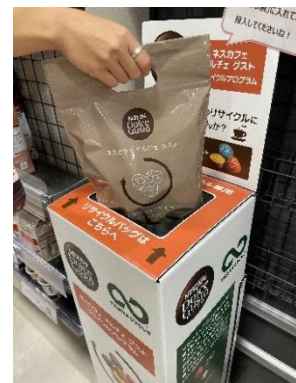
店頭での回収の様子

「ネスカフェ ドルチェ グスト リサイクルプログラム」は、カプセル式コーヒーマーカー「ネスカフェ ドルチェ グスト」の使用済みカプセルを回収し、プラスチックを資源としてリサイクルする取り組みです。ネスレ日本および「ネスカフェ ドルチェ グスト」としては初となるスーパーマーケットの店頭でのカプセル回収活動として、株式会社イトーヨーカ堂の協力のもと、2023 年 3 月より神奈川県内のイトーヨーカドー 7 店舗で「ネスカフェ ドルチェ グスト リサイクルプログラム」を開始したところ、多くの方の参加がありました。好評を受け、このたび新たに東京都、埼玉県、千葉県 の 11 店舗でも同プログラムを実施する運びとなりました。