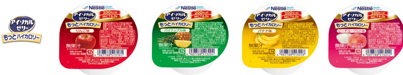
「アイソカル ゼリー もっとハイカロリー」左から:りんご味、パイナップル味、バナナ味、ピーチヨーグルト味

※1 ネスレ調べ [医療・介護現場へ販売されたカップゼリーの販売数量(2022年)より算出]