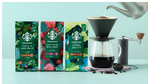
画像(左から):「スターバックス コーヒー ハウス ブレンド 250g」、「同 カフェ ベロナ® 220g」、「同 コロンビア 220g」

また、「スターバックス コーヒー コロンビア 220g(豆)」の新発売にあわせて、スターバックス家庭用コーヒー製品の豊富なバリエーションの中から、お気に入りのフレーバーを見つけていただくためのデジタルコンテンツ「フレーバーファインダー」も 9 月 1 日(金)にリニューアル予定です。 https://nestle.jp/Starbucksathome/how-to-enjoy/#flavorfinder