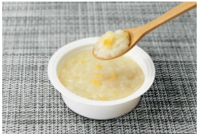
玉子がゆ(スプーンですくうイメージ)