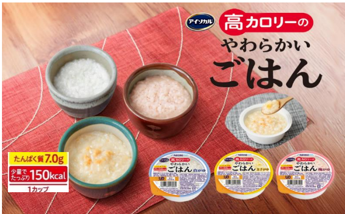
左上: 白がゆ、手前: 玉子がゆ、右上: 梅がゆ

ネスレ日本株式会社 ネスレ ヘルスサイエンス カンパニー(本社:兵庫県神戸市、カンパニープレジデント:中島昭広、以下「ネスレ ヘルスサイエンス」)は、少量高カロリーの介護食「アイソカル 高カロリーのやわらかいごはん」全3種(白がゆ・玉子がゆ・梅がゆ)を、2023年8月8日(火)にネスレ ヘルスサイエンス公式オンラインショップで発売開始します。