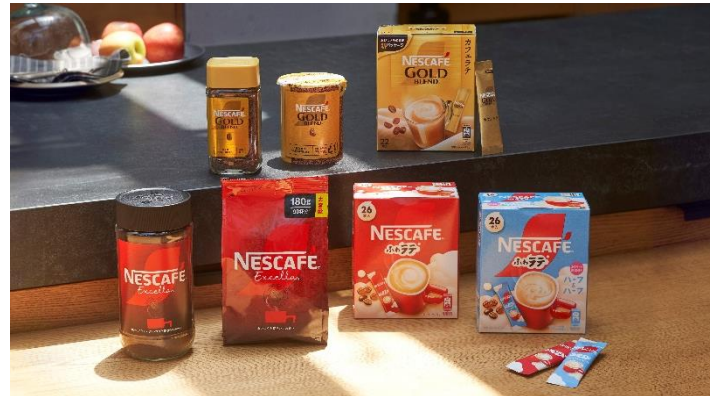
パッケージデザインを刷新する「ネスカフェ」製品