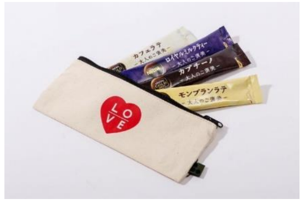
※店内装飾イメージ(左)と限定セット(右)