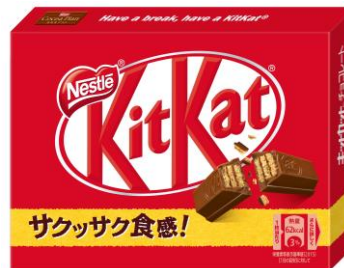
画像(左より): 製品パッケージ(1973年発売時)、「キットカット ミニ 3枚」(現在発売中)