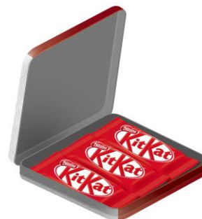
画像:「キットカット ミニ レトロ缶 3 枚」