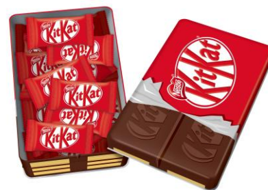
画像:「キットカット ミニ ギフト缶 20 枚」