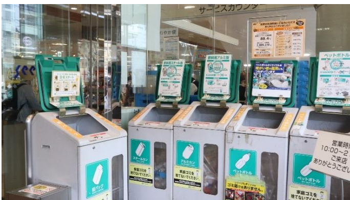
画像(イメージ): コープこうべ シア店(神戸市東灘区)の回収ボックス(全体)