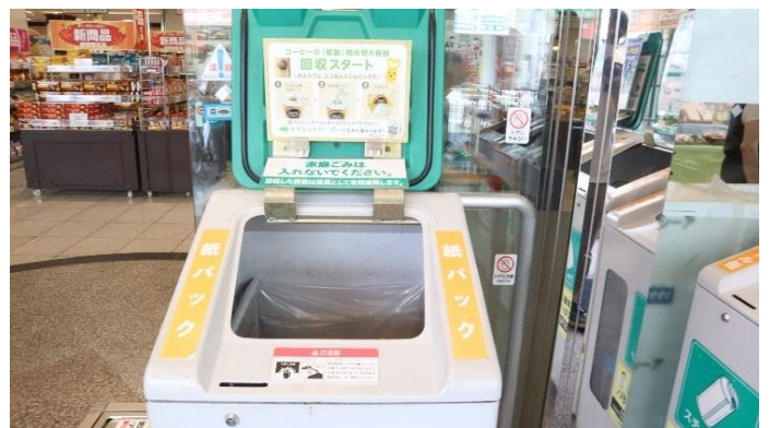
画像(イメージ): コープこうべ シア店(神戸市東灘区)の回収ボックス(紙パック)