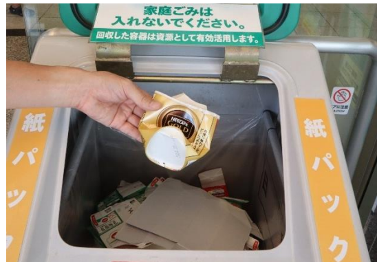
画像(イメージ): 店頭での回収の様子