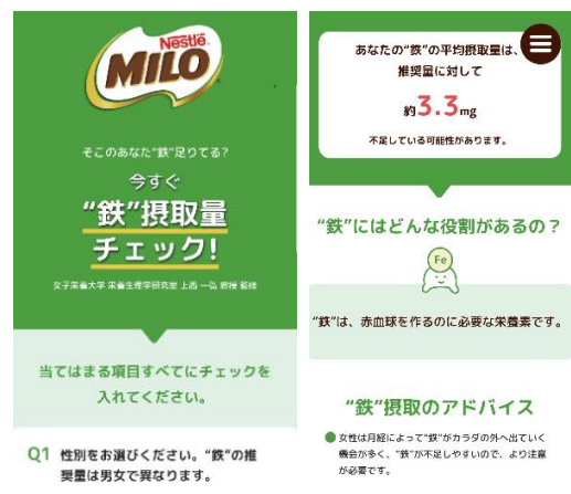
画像(イメージ):「ミロ」ウェブサイト内『“鉄”摂取量チェック』

「ミロ」は、成長期のお子様(7-12歳)の栄養補給にお役立ていただくことを主目的にした製品ですが、2020年より、「ミロ」に含まれる栄養素のうち特に女性に不足しがちな“鉄”に注目が集まり、現在では子供から大人まで幅広い層に「ミロ」をご飲用いただいています。