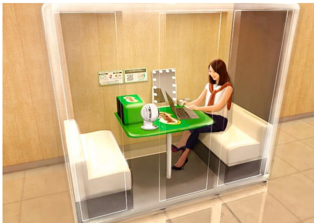
画像(イメージ):「ミロ 鉄分お助け テレキューブ」内部の様子

URL: https://nestle.jp/brand/milo/check/