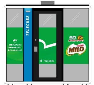
画像(イメージ):「ミロ 鉄分お助け テレキューブ」外観