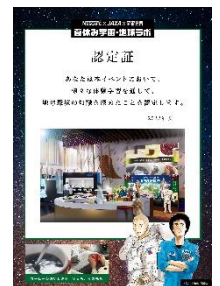
画像(イメージ): 認定証