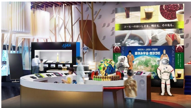
画像(イメージ): 原宿でのイベントの様子

URL: https://nestle.jp/brand/nescafe/nescafe3bai/nescafe-our-planet/