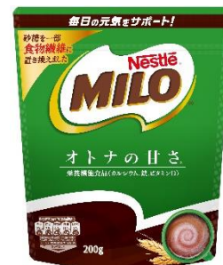
2021年10月発売の新製品 「ネスレ ミロ オトナの甘さ」

「ミロ オトナの甘さ」と「ミロ」マグカップ」のセット 600円(税込) 「ミロ オトナの甘さ」 410円(税込) 「ミロ オリジナル」 410円(税込) 「ミロ オリジナル スティック 5本」 250円(税込)