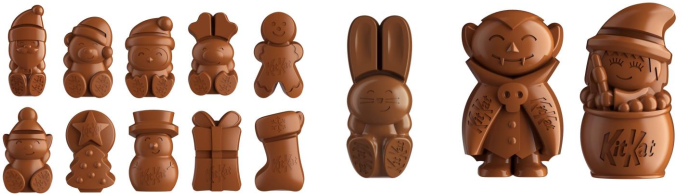
画像(左より):キットカット サンタクロースと仲間たち、キットカット イースターバニー、キットカット ハロウインの不思議な仲間たち