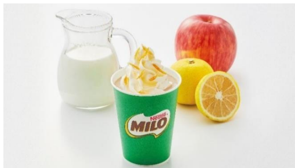
女子栄養大学の学生が考案した特別メニュー イメージ 「香るゆず“ミロ”」(ホット)