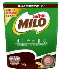
10月18日(月)発売の新製品 「ネスレ ミロ オトナの甘さ」

このたび実施する「ミロ 鉄分お助け隊」は、オフィス街やお出かけスポットといった場所に「ミロ」のキッチンカーが“出動する期間限定イベントです。女子栄養大学の学生が考案した、鉄の摂取や「ミロ」との相性が抜群の季節のフルーツと、10月18日(月)発売の新製品「ネスレ ミロ オトナの甘さ(以下、「ミロ オトナの甘さ」)」(※参考資料)を組み合わせた特別アレンジメニュー2種をはじめとしたドリンクを提供するほか、イベント期間中は女子栄養大学の学生が「鉄摂取の啓発リーフレット」を用いた栄養アドバイスを行います。(※3)2021年3月から8月と2019年同期の売上(金額ベース)の比較