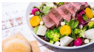
グリルステーキとゴロッと野菜のサラダ(※2)

睡眠、特に眠気の科学の第一人者である広島大学 林 光緒教授のアドバイスを参考に開発したメニューとして、アミノ酸の一種であるトリプトファンを含む食事2品、シャキッとさせるのにおすすめのデザート1品の計3品を提供します(※1)。