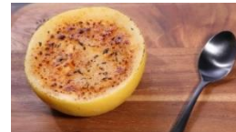
グレープフルーツブリュレ