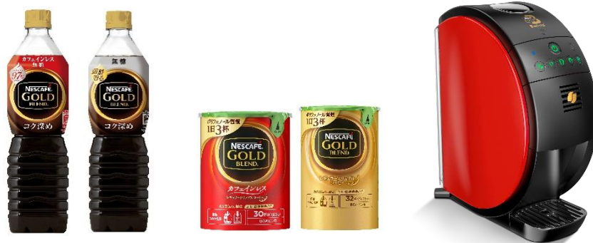
画像(左から): 「ネスカフェ ゴールドブレンド コク深め ボトルコーヒー カフェインレス」、「ネスカフェ ゴールドブレンド コク深め ボトルコーヒー 無糖」、「ネスカフェ ゴールドブレンド カフェインレス」、「ネスカフェ ゴールドブレンド」、「ネスカフェ ゴールドブレンド パリスタ 50[Fifty]」

アイスの場合は「ネスカフェ ゴールドブレンド コク深め ボトルコーヒー」を、ホットの場合はコーヒーマシン「ネスカフェ ゴールドブレンド パリスタ」で淹れた「ネスカフェ ゴールドブレンド」を提供いたします。