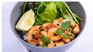
スパイシーシュリンプライス(※2)