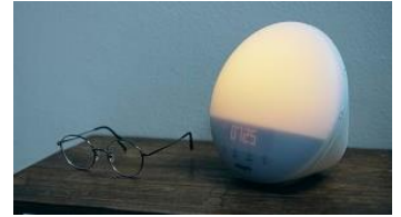
「SmartSleep ウェイクアップ ライト」

「ネスカフェ 睡眠カフェ in 原宿」では、睡眠課題に光でアプローチし、心地よい就寝と目覚めをサポートする「SmartSleep ウェイクアップ ライト」をはじめとした、フィリップスの睡眠領域におけるソリューション「SmartSleep シリーズ」全 3 製品（※参考資料）を実際に手に取り、お試しいただけます。