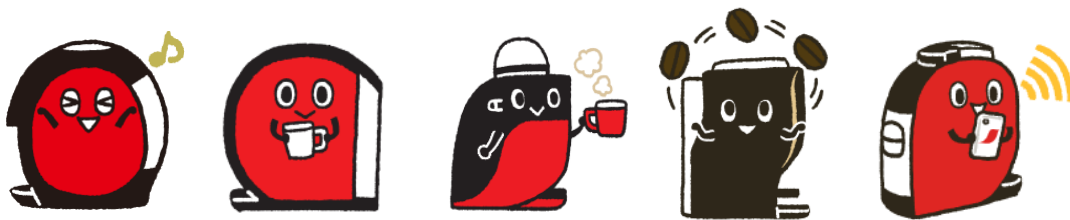
左から: アイちゃん、フィフティ君、シンプル君、デュオ君、ダブリュー君

2012年に誕生。ウェブサイトや「ネスカフェ アプリ」内で「バリスタ」の使い方や楽しみ方を教えてくれるマスコットキャラクターです。