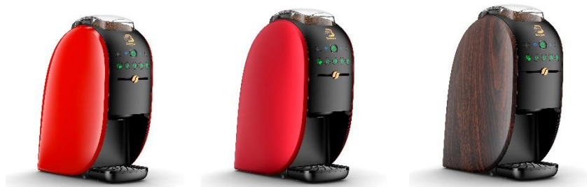
左から:「ネスカフェ ゴールドブレンド バリスタ W [ダブリュー]」レッド、「同」プレミアムレッド、「同」ウッディブラウン