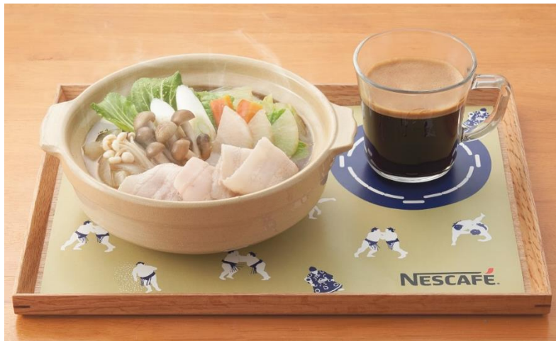
陸奥部屋 ポリフェノールたっぷり ちゃんこ鍋 セット(イメージ)