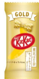
東京ばな奈 キットカット ゴールド 「見つけたっ」 バナナキャラメル味 個包装