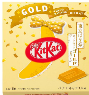
東京ばな奈 キットカット ゴールド 「見つけたっ」 バナナキャラメル味 15 枚入り