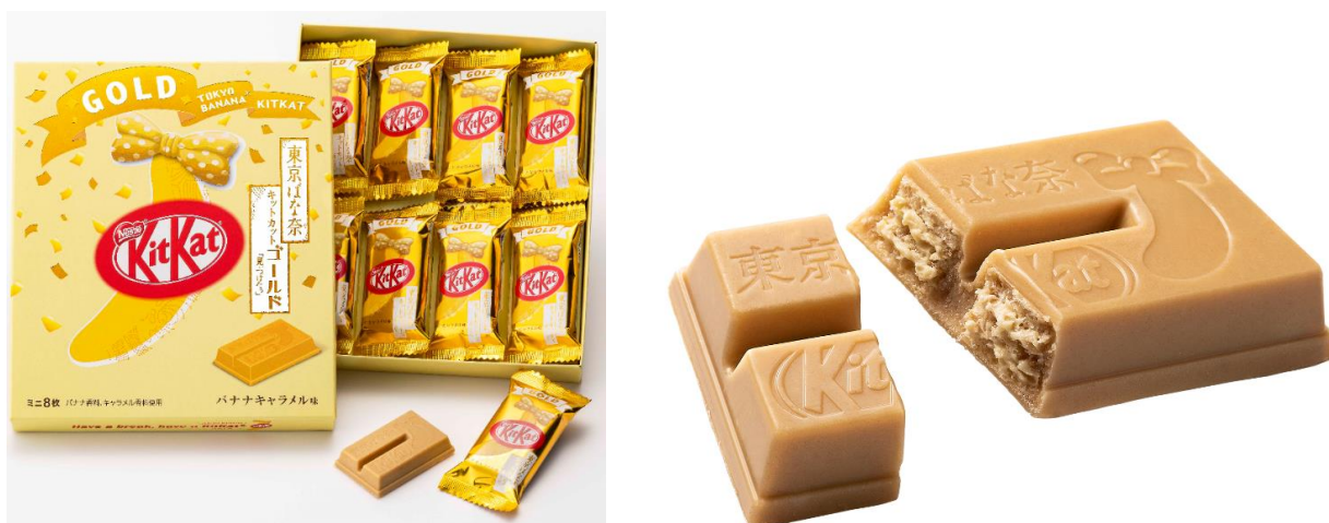
東京ばな奈 キットカット ゴールド「見つけたっ」バナナキャラメル味