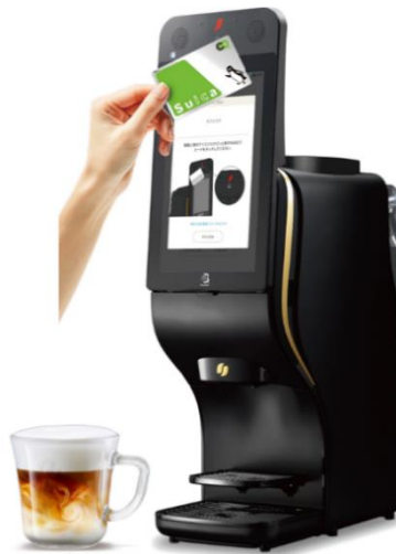
「ネスカフェ ゴールドブレンド バリスタ デュオ プラス」