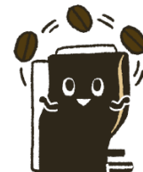
左から: アイちゃん フィフティ君 シンプル君、デュオ君