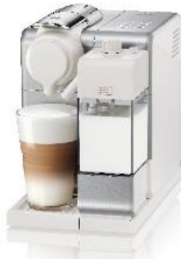
ラティシマ・タッチ プラス シルバー