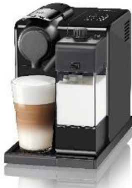
ラティシマ・タッチ プラス ブラック

カプセルコーヒー、専用コーヒーメーカー、トータルサポートによる“至福のコーヒー体験”を提供するこだわりのコーヒーブランド「NESPRESSO(ネスプレッソ)」(ネスプレッソ株式会社 本社:東京都品川区、代表取締役社長:パスカール・ルバイー)は、2018年9月18日(火)より、ワンタッチで本格的なカプチーノやラテ・マッキヤートが楽しめる人気の「ラティシマ」シリーズに、より充実したミルクメニューがお楽しみいただけるコーヒーメーカー「Lattissima Touch Plus (ラティシマ・タッチ プラス)」を新たにラインアップに加え、販売を開始します。