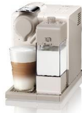
ラティシマ・タッチ プラス ホワイト

日本では自宅でコーヒーを飲む際、約6割以上の方が牛乳またはクリームと共に楽しむと言われています。「ラティシマ・タッチ プラス」は、多様化するミルクを使ったコーヒーメニューのお好みにお応えするため、カプチーノ、ラテ・マッキヤート、あたたかいフォームミルクに加え、新たにたっぷりの牛乳を使用したミルクィな味わいの“クリーミー・ラテ”がメニューボタンに加わりました。「ラティシマ・タッチ プラス」は本格的な6種類のメニューを、ご自宅で一杯ずつ手軽にお楽しみいただけるミルクメニュー対応型コーヒーメーカーです。