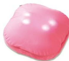
ドクターエア 3D マッサージクッション