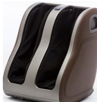
ドクターエア 3D フットマッサージャーS