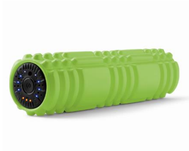
ドクターエア 3D マッサージロール