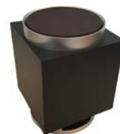
R-LIVE ハイレゾ自然音の 空間デザインシステム