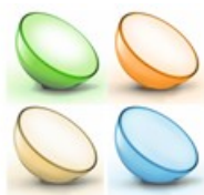
IoT 照明 フィリップス Hue

(2) ハイレゾ音源の、森や川の自然音で眠りを誘う安眠ミュージックを用意します。ハイレゾ音源は従来の圧縮音源と比較して、脳に快感及び安心感を与え、不快感や不安感を減少させる、という研究結果があります。