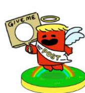
エンジェルポスト