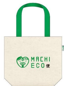
【写真】エコバッグ(イメージ)

ラストワンマイルの配送荷物をできるだけ1つにまとめて、佐川急便がECO HUBへ配送することで、トラックからのCO2排出量の削減につながります。また、ECO HUBからの最終お届けは、原則として、徒歩または自転車で行います。さらに、最終お届け先までの配送は段ボールを使用せず、荷物を取りに来ていただくサービス利用者にはオリジナルのエコバッグを提供します。段ボール資材の使用も削減し、「地球にやさしい」新たな配送サービスを提供します。