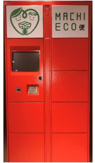
【写真】専用の宅配ロッカー(イメージ)