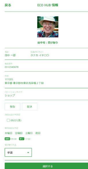
【写真】「ECO HUB」情報のイメージ