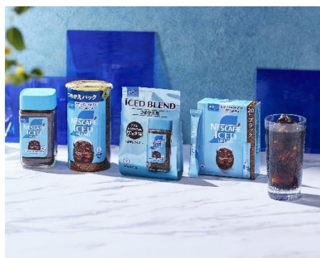
「ネスカフェ アイスブレンド」