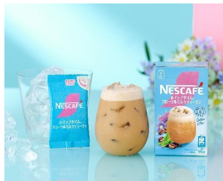
「ネスカフェ ホイップタイム フローラルミルクティーラテ」