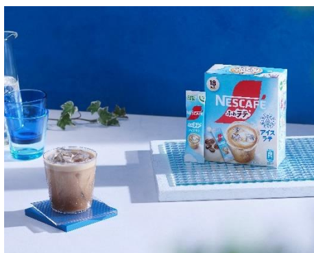
「ネスカフェ ふわラテ アイスラテ」