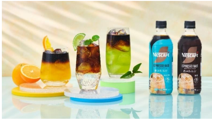
「ネスカフェ エスプレッソベース」とさまざまな飲み物との組み合わせ

ネスレ日本は、1960年に「ネスカフェ」を発売して以来、皆様の大切な1杯であり続けるために品質を追求し、技術革新を続け、日本のコーヒー文化の発展に貢献してきました。現在、日本で飲まれるコーヒーの約40%はアイスとなりその割合は年々増加しています(※2)。アイスコーヒーは、そのままブラックで楽しむことはもちろん、アレンジを加えることで新たな魅力が生まれます。近年、コーヒーやエスプレッソを使用した多彩なアイスメニューを提供するコーヒー専門店やカフェが増加しており、既存のルールにとらわれない自由な発想でのコーヒーの楽しみ方が特に若い世代の間で人気を集めています。(※2)2024年時点、株式会社消費者行動研究所「飲み物調査」