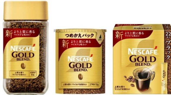
画像(左から):「ネスカフェ ゴールドブレンド 80g」、「同 エコ&システムパック 55g」、「同 スティック ブラック 22P」