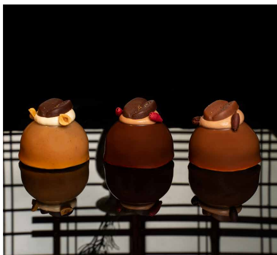
左)トリマ 中央)リーヴゴージュ ネスプレッソ 右)プレジールシュクレ ネスプレッソ