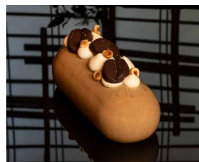
サイズ:約 縦19.0cm X 横7.0cm X 高さ6.5cm

コロンビアコーヒー トリマを旅するアントルメ ノマドに昇華させたこの「ノマド トリマ」は、ヘーゼルナッツの優しい甘みが口いっぱいに広がり、それからパワフルなコーヒーが全体にバランスをもたらします。重層的なフレーバーの中で、さまざまな食感が代わる代わる発揮され、味覚の喜びを増幅させます。