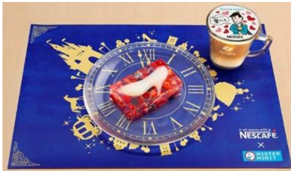
シンデレラ スイーツ・ミニ (イメージ)