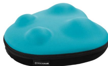
ドクターエア ボディクッション