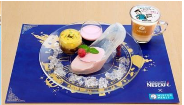
シンデレラスイーツ(イメージ)