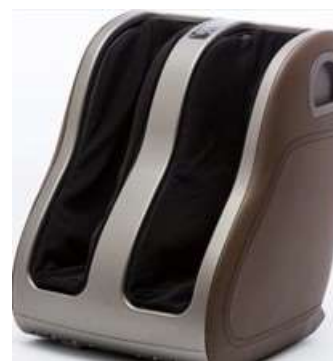
ドクターエア 3D フットマッサージャーS