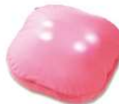
ドクターエア 3D マッサージクッション