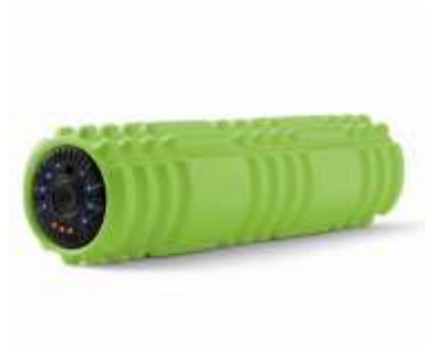
ドクターエア 3D マッサージロール