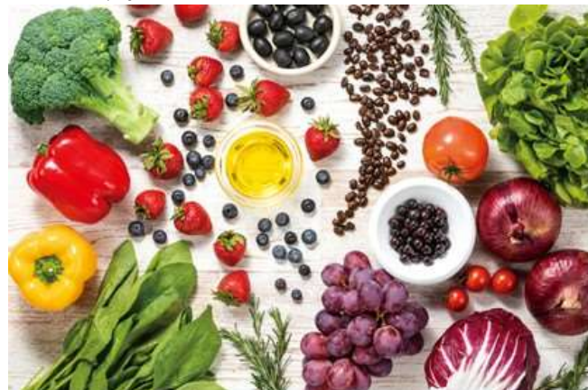
ポリフェノールが含まれる食材(イメージ)